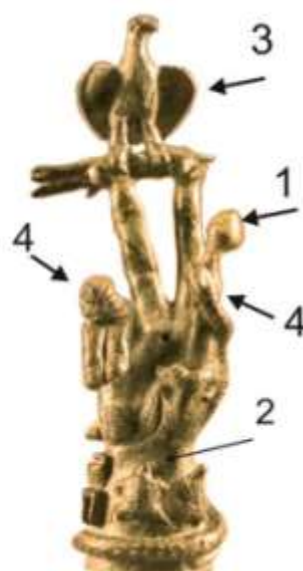
Museum of fine arts, Boston

В древната религия Духът е с космически измерения, всеобхватен и всепроникващ, Отецът и Майката са боговете на реалния, земния свят.