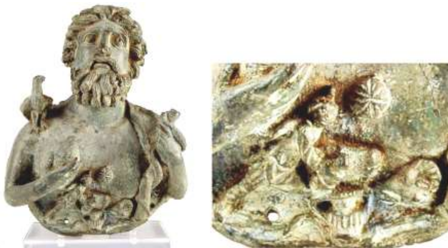
Фиг. 11. 21 Умиращият Сабазий с шишарка в ръка; тауроскония, урна змия и овен

Следващият релеф (Фиг.11), директно показващ смъртта на Сабазий, е една „странна симбиоза“ между бюста на Сабазий и сцената на тауроскония (бикоубийство), изобразена на гърдите на Сабазий (скулптура от музея във Ватикана). Сцената може да бъде определена като елемент на синкретизъм, смесване на две религии, но това не е така – тя отразява ритуала „убийство“ на Сабазий. До сина, Сабазий в момента на неговата смърт, са Майката и Отеца – змия и орел, в дясната си ръка Сабазий държи шишарка, символ на това, което остава след него – семето, животът.