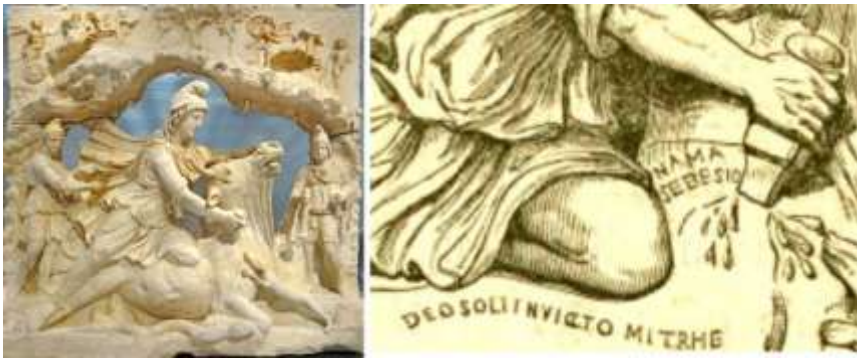
Фиг. 10 20

Според Франц Кюмон 18 „NAMA SEBESIO“ е неясно варварско заклинание. По-вероятна обаче е версията зад „нама“ да е санскритското „нама“, използвано в изразите „нама Вишну“, „нама Шива“, и преведено като „слава, поклон, почитание“ 19 ; в турския и персийския „намаз“ е молитва. Така надписът добива най-общ смисъл: слава, поклон, молитва за Сабазий.