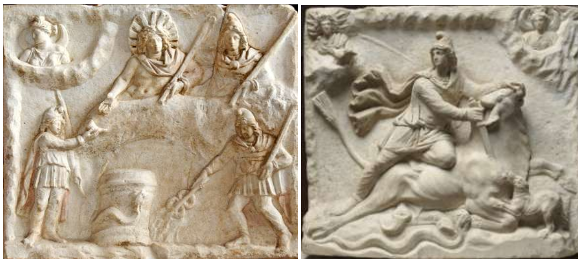
Фиг. 9 Двете страни на релефа от Лувър

Този релеф бих нарекъл български по много причини. Зима е, хората са облечени в топли дрехи, жертвеното животно, бикът, е убито, зад жертвеника гори огън, над който един от участниците поднася кадуцей/сурвачка; слънцето е слязло при хората.