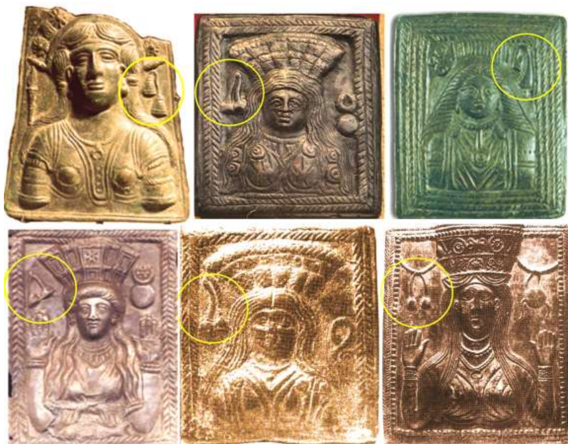
Фиг. 1 1

Останалите четири релефа са от музея в Разград. На всичките изображения, редом с богинята, е изобразена мартеница.