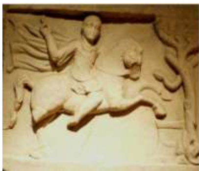
Фиг. 6 Истанбул