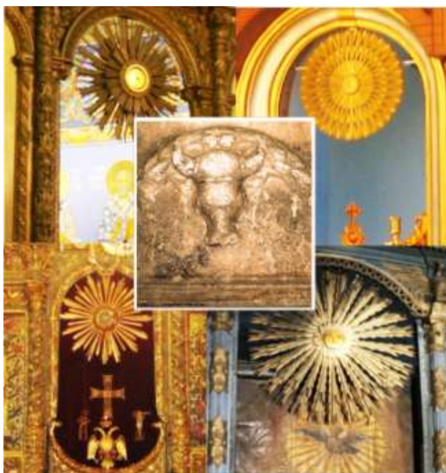
Фиг. 17. Слънце пред олтарите; бикът под колоната на Иван Асен 27

В българските храмове и сега пред олтара е изобразявано Слънцето, а в черквата „Свети Четиридесет мъченици“ и сега под колоната с надписа на Иван Асен стои символът на Сабазий – бикът.