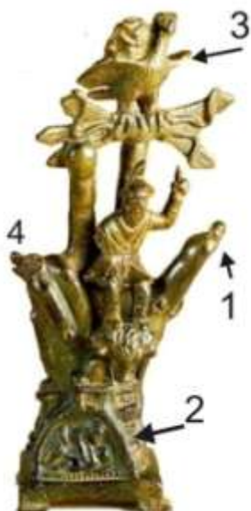
Фиг. 7 Saint Louis Art Museum

Същия смисъл демонстрират и т.нар. ръце на Сабазий (Фиг.7). На палеца винаги е изобразявана шишарка (1), олицетворение на Дървото на живота, символ на Духа на живота, или Светия Дух, взимстван по-късно в християнството. Другите два пръста съответстват на орела – бащата (3) и майката (2). символизирана от земноводно (костенурка).