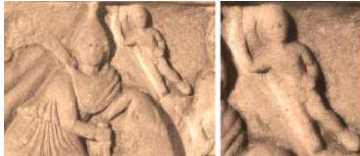
Фиг. 12. АМ Клуж, Трансилвания

Друг митраистки релеф, в който се показва символиката бик – Сабазий, е релефът от Драго, Румъния 22 (Фиг.12), на който над умиращия бик има изображение на... човек, възходящ към нищото. Дясната ръка е с изправени три пръста в „знака на Сабазий“, или Светата Троица, в лявата е неизменният Сабазиев атрибут – шишарката. Бикът умира, възнася се Сабазий.