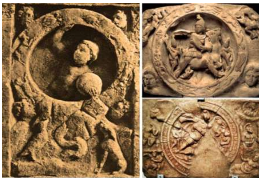
Фиг. 16. Митра, медиатор на времето 24 27-2 25 27-3,27-4

Но кой е Митра? В ритуалната религия на честване на Слънцето, наречена от историците римски митраизъм, Митра е дефиниран от самите релефи – Митра е този, който превърта колелото на времето (Фиг.16), богът време, Митра – Кронос, който убива своите деца, сезоните; неизбежният Бог на времето, който един ден идва и на когото всички принадлежим.