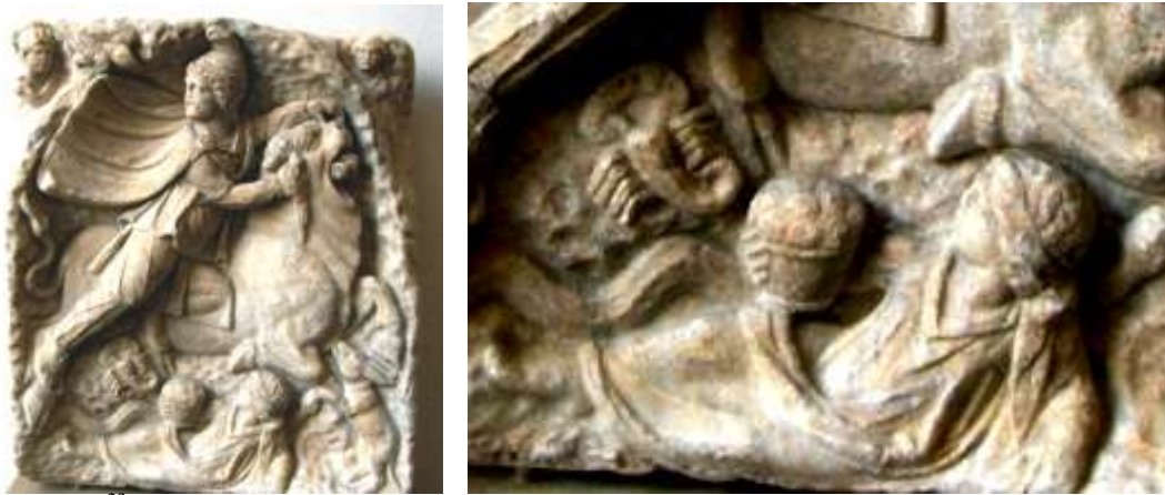
Фиг. 15 23

Релеф, изобразяващ директно идеята за раждане, е римският релеф (Фиг.15), в който има съществен, нетипичен елемент, също тотално невместващ се в астралната идея на тълкуването на митраизма – това е жената, изобразена в основата на релефа: