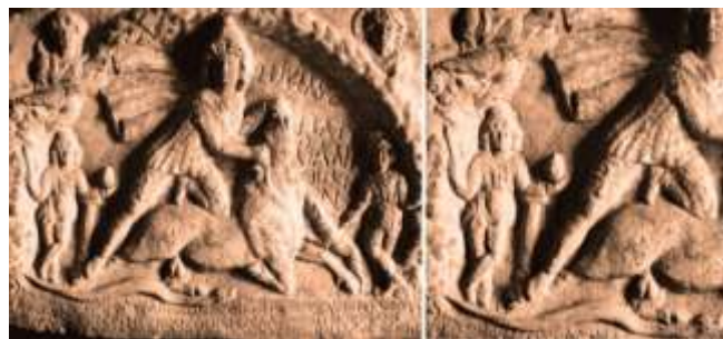
Фиг. 13. Археологичен музей Констанца

Шишарката на Сабазий е в ръката и на факлоносеца от релефа от музея в Констанца (Фиг. 1, Румъния.